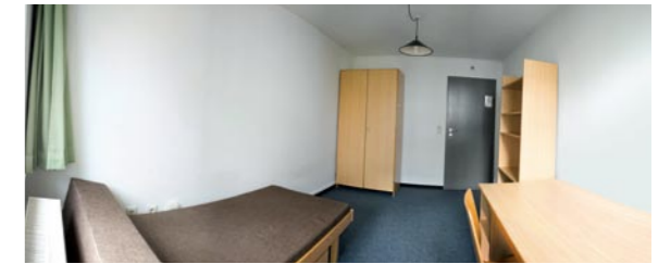
Schreibtisch, Bett, Schrank und Regal – alle Wohnheimzimmer in Vaihingen sind zwölf Quadratmeter groß und identisch eingerichtet